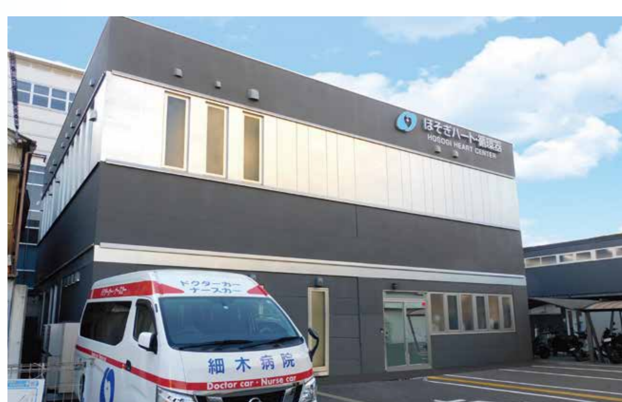
ほそぎハートセンター 5周年 (2025)