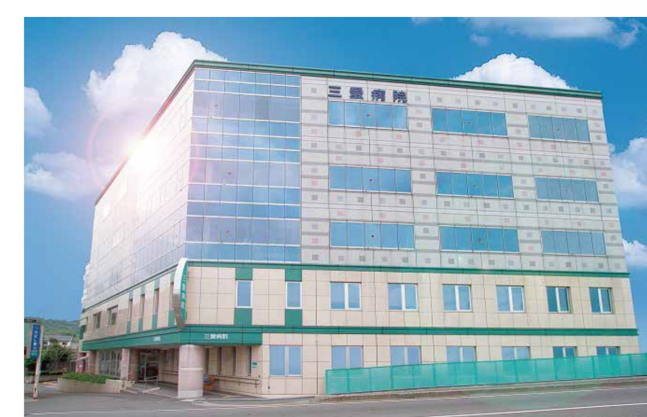
三愛病院 50周年 (2025)