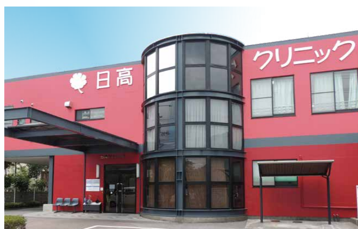
日高クリニック 30周年 (2026)