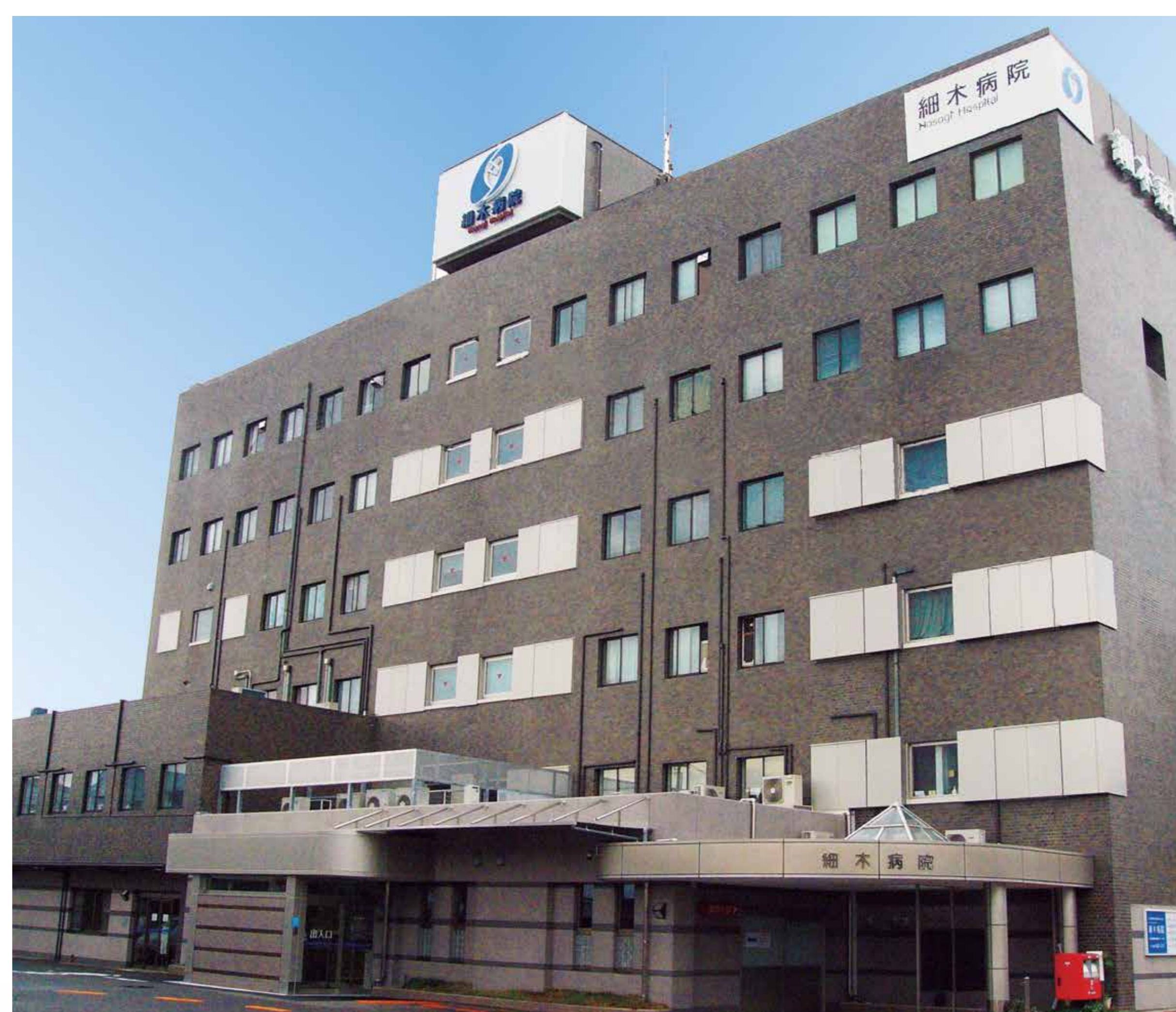
細木病院 (細木診療所) 80周年 (2026)