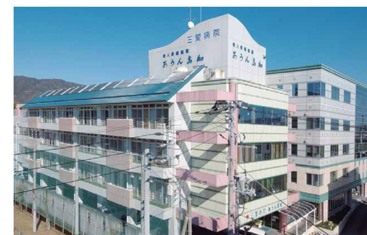
あうん高知 30周年 (2025)