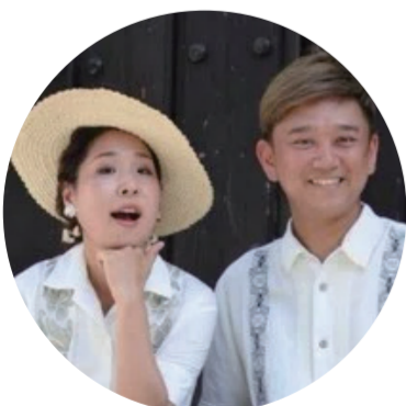
サンドイッチパーラー