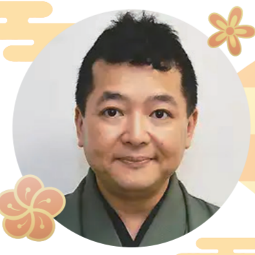
真打落語家(高知市出身) 瀧川 鯉朝