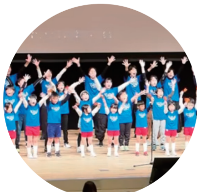
第四小学校 / 上街保育園 / 城西中学校